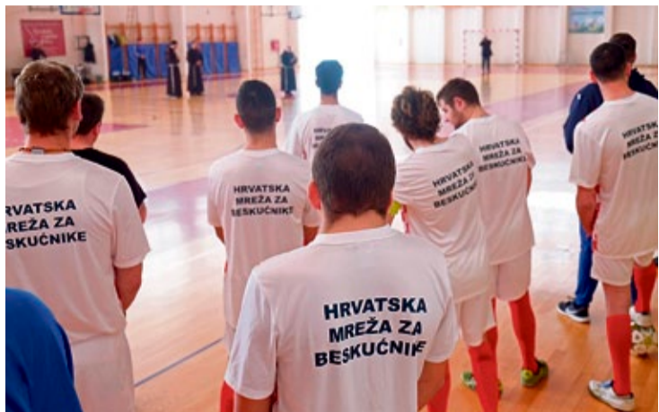
Nastupila je i momčad »Hrvatske mreže za beskućnike«