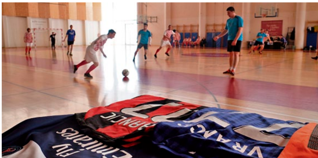
Samoborski turnir u športskoj dvorani u sjeni redovnikovih dresova: na mnoge je fra Juraj otisnuo broj »77« i svoje prezime »Vrančić«