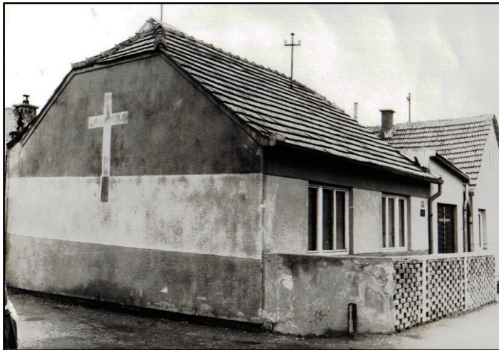
Prva crkva – kuća koja je prenamijenjena za bogoslužje